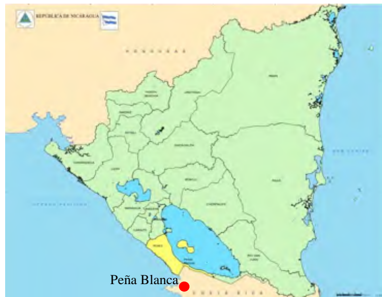
Figura 1. Localización del Puesto de control de frontera Peña Blanca

El Puesto de Control de Frontera de Peña Blanca, principal vinculación por carretera entre Nicaragua y Costa Rica, se encuentra ubicado en el Municipio de Cárdenas, Departamento de Rivas, aproximadamente a 147 kilómetros al sureste de la ciudad de Managua.