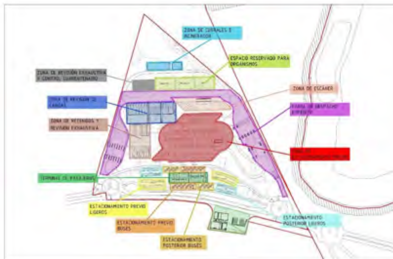
Figura 3. Plano de Zonas

El plano de usos desarrollado en el Pre diseño, presentado en el ANEXO III: inciso 2.1.1, pág. 16 y expuesto a continuación, fue analizado y consensuado por las instituciones involucradas en el proceso de control por lo que deberán de mantenerse los criterios y distribución definidos. Únicamente podrán ser sujetos a modificaciones en el diseño si las condiciones técnicas comprobadas por el Contratista así lo justifiquen, por lo que se deberá evaluar las estructuras existentes y proponer las adecuaciones necesarias o ser objeto de demolición total o parcial. En ese sentido, deberá analizarse con especial énfasis, el edificio administrativo, área del escáner y parqueos de concreto hidráulico conexos al mismo, a fin de tratar de aprovechar al máximo estas infraestructuras.