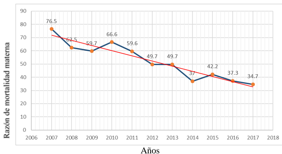
Gráfico No. 1 Razón de Mortalidad Materna Nicaragua 2007-2017

Fuente: Oficina Nacional de Estadísticas (ONE-DGPD-MINSA)