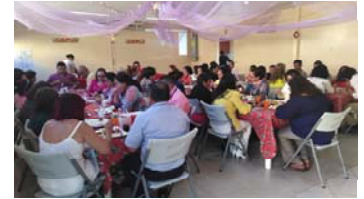
Familia DGFP durante la celebración de fin de año.

Fue una tarde muy bonita y alegre donde se compartió un momento de esparcimiento y unidad familiar. Entre risas y anécdotas de eventos vividos durante el año que se despidió, el personal de la DGFP fortaleció el lazo y el compromiso para afrontar cuanto venga en el año 2020, con la seguridad que no se declinará una labor que coadyuva a lograr la sonrisa de la niñez o la esperanza de una persona de la tercera edad.