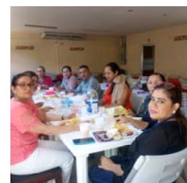
Comisión Mixta de Higiene y Seguridad del Trabajo DGFP

Se espera dar continuidad al trabajo de la Comisión Mixta en enero próximo, con aires de cambios y robusteciendo los lazos de colaboración.